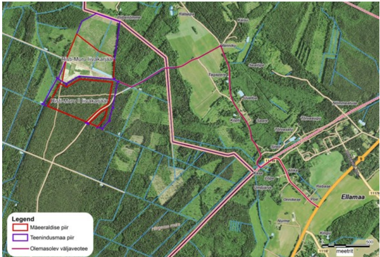
Joonis: Kavandatava tegevuse piirkond (mäeeraldised, teenindusmaad (peale 01.11.23. a) ja peamine väljaveotee (maanteele nr 9)). Aluskaart: Maa-amet, 2024.